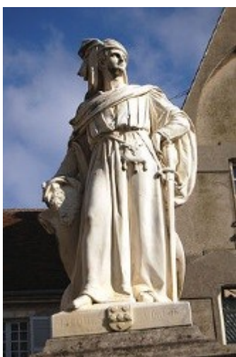
Statue de Jacques Cœur

L'homme qui symbolise le mieux Bourges est sans doute Jacques Cœur , grand argentier du roi Charles VII et né à Bourges. C'est avec l'argent qu'il prête à la cour et au roi qu'il permet au "petit Roi de Bourges" de bouter les Anglais hors de France.